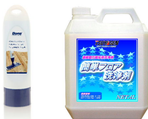
カートリッジ 簡単フロア洗浄剤