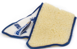
アプリケーターパッド