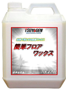
簡単フロアワックス