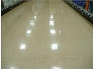
Pタイル・セラミック床等