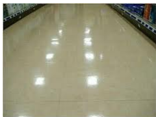
Pタイル・セラミック床等